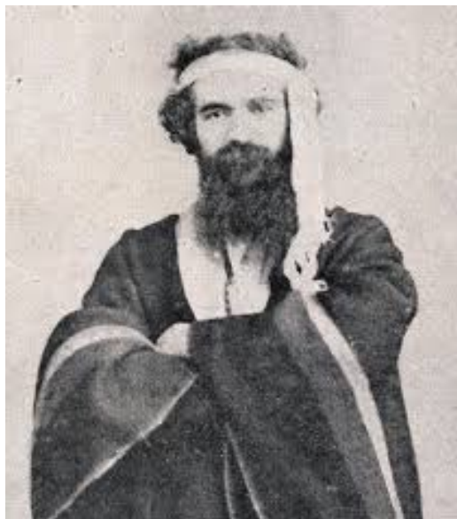
Orélie-Antoine de Tounens.

Ese año, el reino de la Patagonia —que pudo haber servido de modelo a la «Pologne» (al estilo de Jarry)— no existía ya si quiera como mero recuerdo. Fundado por un aventurero francés que tomó el título único de Orélie-Antoine I, el reino de la Araucanía y de la Patagonia tendría una existencia comprobable entre 1860 y 1862 gracias al apoyo de grupos Puelches y Tehuelches de la región hasta que tuvo lugar la conquista de Perquenco, capital del reino, a manos de tropas del ejército chileno. Si bien Jarry no se refiere explícitamente a dicho reino, del siguiente retrato del efímero rey-campesino Orélie-Antoine de Tounens (La Chaise, Francia, 12 de mayo de 1825 - † Tourtoirac, Francia, 19 de septiembre de 1878) se desprende un sorprendente aire de familia.